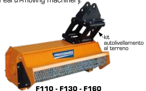
F110 - F130 - F160