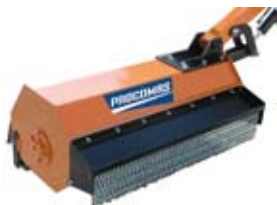
F80 - F100L

and flow of hydraulic oil available in the hydraulic circuit of the machine. Supplied complete with hydraulic engine and by request with coupling for several earth-moving machinery.