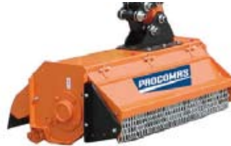
F100 - F120