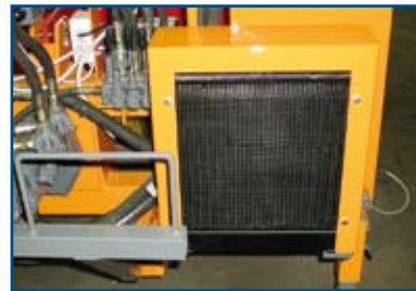
Impianto di raffreddamento aria/olio (montato) Oil cooler (mounted)