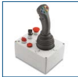
Comandi elettro-idraulici a portata costante con joystick Electro-Hydraulic controls with joystick