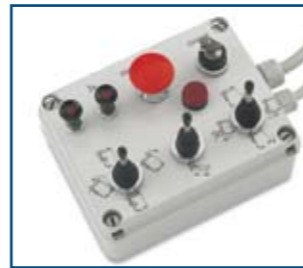
Comandi elettro-idraulici a portata costante con mini-manipolatori Electro-Hydraulic controls with mini-manipulators