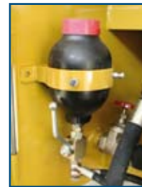
Compensatore idro-pneumatico sul cilindro alzata Hydropneumatic compensator